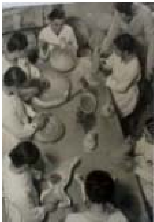
Sector de modelado para el aprendizaje.

Por los datos que hemos aportado podríamos decir que el taller de Cerámica del Divino Rostro fue creado hace unos cien años, junto a los otros talleres que mencionamos y cuya enseñanza se impartió a niñas y jóvenes. Pero este taller de cerámica, técnica artesanal inusual en la Argentina de esa época, se desarrolló y creció.