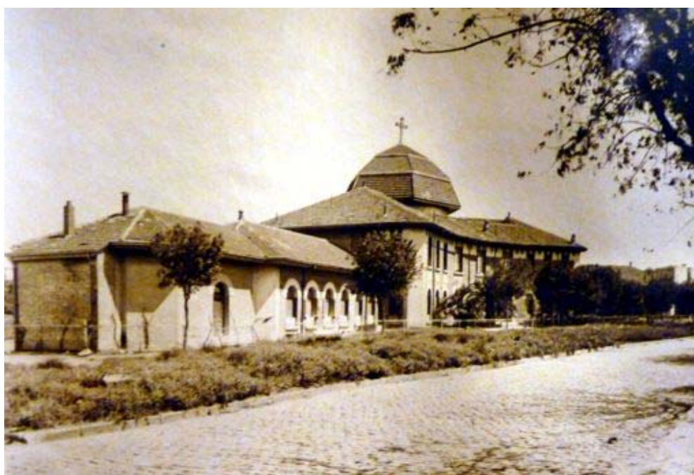
Una vista de la Escuela taller del Divino Rostro, en su primera etapa.