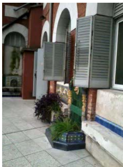
Fachada del sector destinado al Taller de cerámica