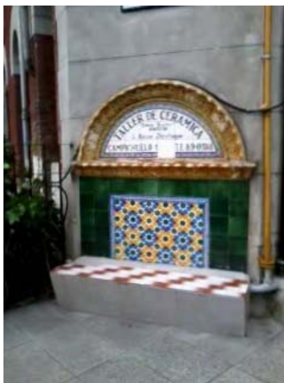
Vista de la antigua entrada al taller de cerámica

En las dos exposiciones industriales comunales realizadas en Buenos Aires en 1927-1928 obtuvo medalla de oro y 1000 pesos m/n.